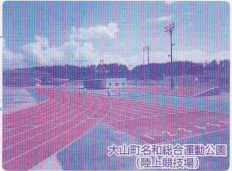
大山町名和総合運動公園 (陸上競技場)