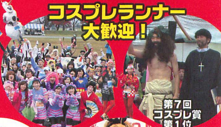
第7回 コスプレ賞 第1位