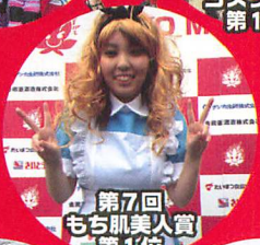
第7回 もち肌美人賞 第1位