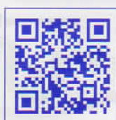
QRコード対応の携帯電話を従って、申込サイトにアクセスできます。