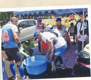
レストステーション 55kmのレストステーションではエイドの他、ウェアやシューズの取り替えも可能。後半に向けてしっかり休息を!