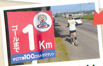
フィニッシュまであと少し ワッカを抜ければフィニッシュまで一直線!

100kmの「旅」の締めくくりは、全身で喜びを表現。最高の笑顔を見せてください!