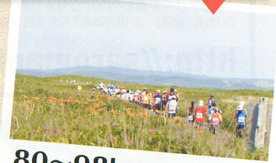
80～98km 一面に広がる絶景、ワッカ原生花園はサロマ湖のクライマックスであると同時に、終盤の踏ん張りどころ