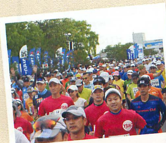
START 100kmの部は朝5時に湧別総合体育館前をスタート!