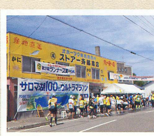
68km地点 私設エイドも選手をお迎え。現地の応援を力に!